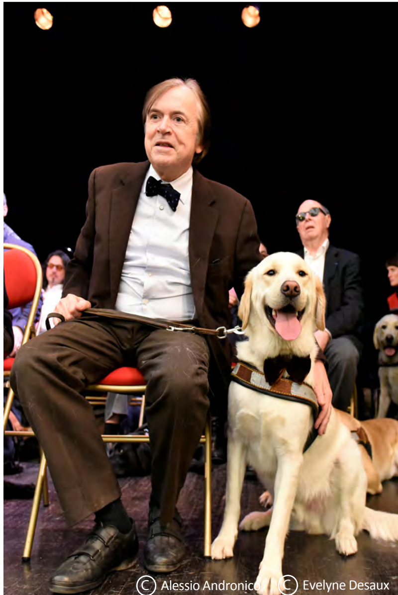
© Alessio Andronico © Evelyne Desaux

Un grand remerciement à la ville de Saint-Mandé, qui accueillait lundi 12 février l'école dans sa salle des fêtes pour notre cérémonie des remises de l'année 2017 et le lancement du parrainage de Monty, notre 1000e chien guide.