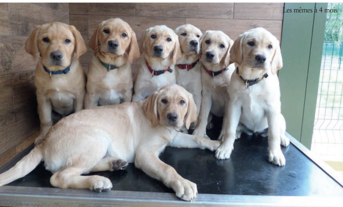
Les mêmes à 4 mois