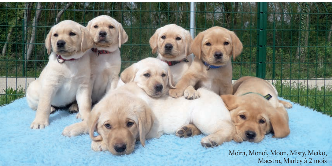
Moira, Monoi, Moon, Misty, Meiko, Maestro, Marley à 2 mois