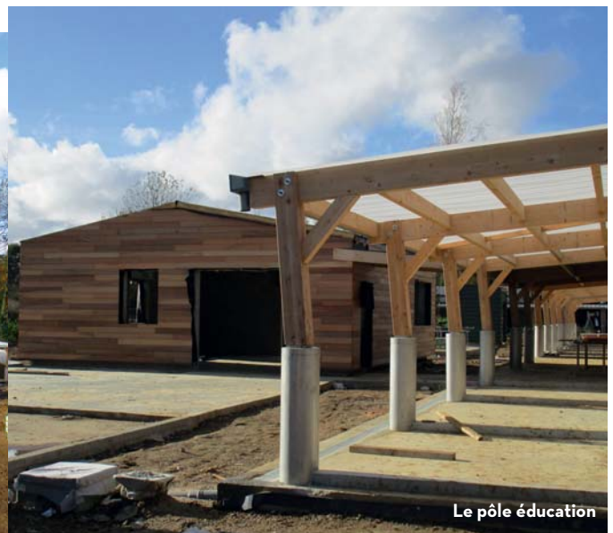
Le pôle éducation