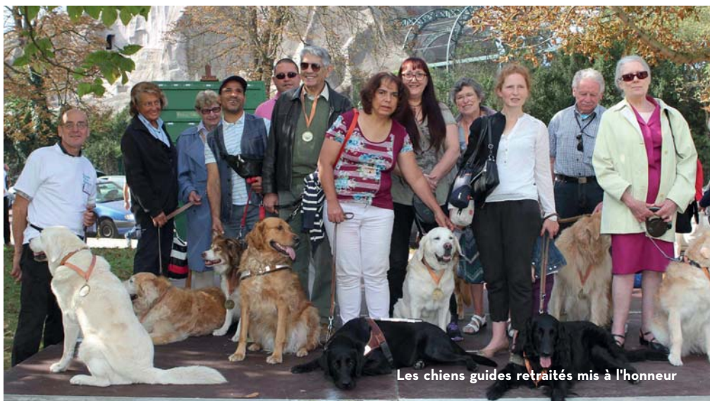
Les chiens guides retraités mis à l'honneur

Soulignons la présence au sein de notre village associatif : des aveugles de Créteil, de l'ANMCGA, des associations "Au fil des contes, un fil de vie", "Coup de patte" et "Entre Chiens et Nous".